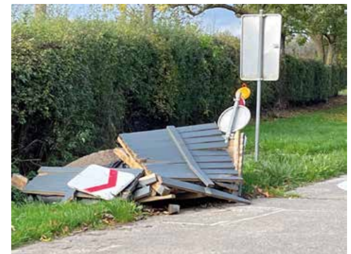
Dit hoopje puin was ooit een bloembak. De vandalen die hier aan het werk waren, bleven onbestraft.

N-VA Zoutleeuw draagt de veiligheid van onze inwoners hoog in het vaandel en wij zullen blijven hameren op meer veiligheid en leefbaarheid in onze gemeente.