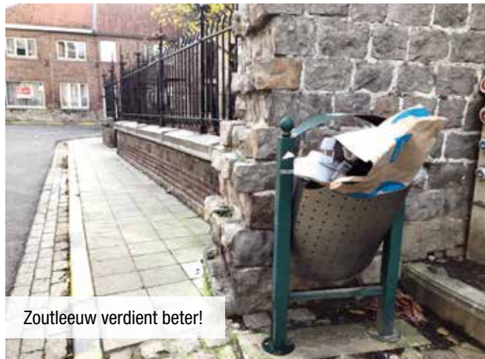
Zoutleeuw verdient beter!

Het wandelgebied waar vroeger het gemeentehuis was en waar nu speeltuigen het park opfleuren, is wel aantrekkelijk. Maar ... enkel voor onze kinderen en jongeren. Doordat het gebied moeilijk toegankelijk is met een rolstoel of rollator, is het voor onze senioren en minder mobiele inwoners helaas niet bereikbaar. Dat is heel jammer, want net daar zou een mooie doorsteek tussen enkele woonzorgcentra en het centrum op zijn plaats zijn. Stof om over na te denken. En daar knelt het schoentje. Wordt in Zoutleeuw wel nagedacht? Is er een langetermijnvisie? Waar willen we als gemeente naartoe? De problemen die zich in onze gemeente voordoen, zijn het resultaat van een jarenlang gebrek aan visie. Is dat wat de Zoutleeuwenaars willen?