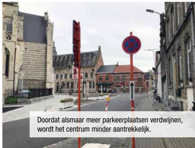
Doordat alsmat meer parkeerplaatsen verdwijnen, wordt het centrum minder aantrekkelijk.

naar de kerk en de herinrichting van de grote Markt. Maar dan zijn we uitgepraat. De naburige straten zijn momenteel niet aantrekkelijk. Ook niet om in te wonen. Het drukke verkeer, het gebrek aan parkeermogelijkheden en het uitsterven van sommige diensten hebben niet alleen een negatief effect op onze handelaars, maar ook op de inwoners van onze stadskern. In Zoutleeuw is het druk op piekmomenten en doods op andere momenten.